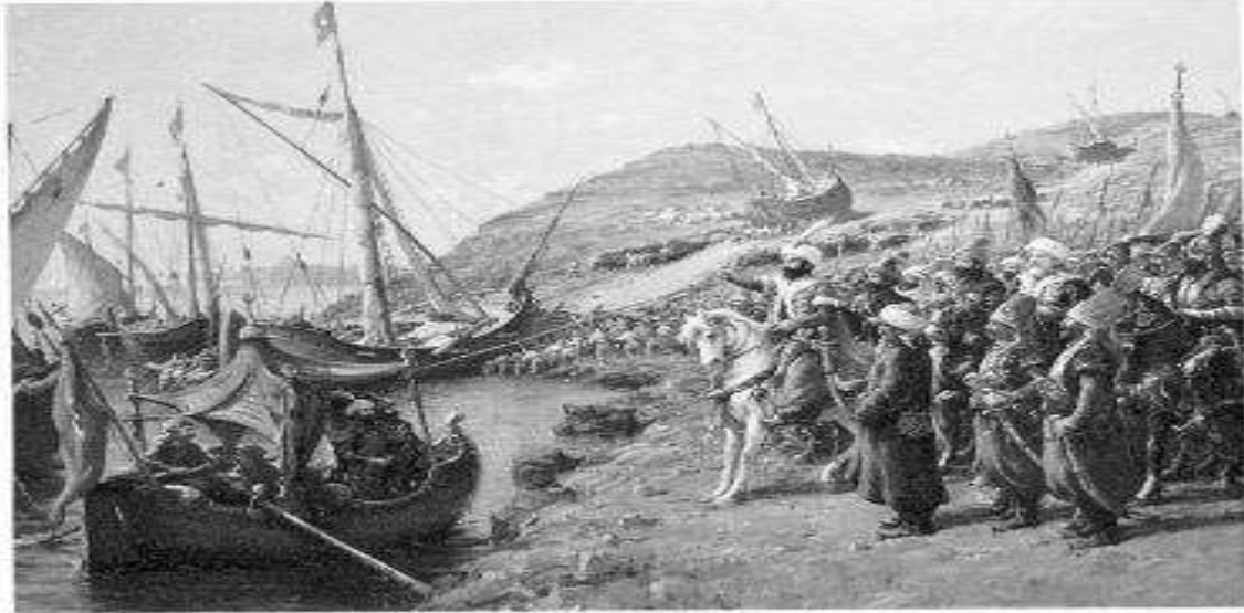
Ο Μωάμεθ Β' κατάφερε με ένα έξυπνο και προσεκτικά μελετημένο σχέδιο τη μεταφορά των στόλου του στον Κεράτιο κόλπο χωρίς να γίνει αντιληπτός από τους αντιπάλους- στη φωτογραφία η «υπερκατασκευή» του οθωμανικού στόλου σε ελασμογραφία του Ιταλού ζωγράφου της οθωμανικής Αυλής Fausto Zonaro (Ανάκτορο Ντούμα Μπακτάς, Κωνσταντινούπολη).

Ο Μωάμεθ Β' καταλαμβάνει τον Κεράτιο κόλπο (που φυλασσόταν με αλυσίδα) (πέρασε 70 καράβια σέρνοντάς τα 9 χιλιόμετρα πάνω στη στεριά-πάνω σε κορμούς δέντρων)